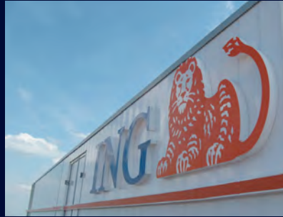
Ombouw van Postbank naar ING