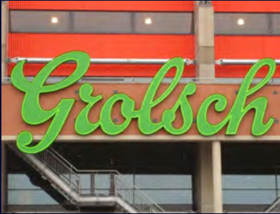
Grolsch: alle externe huisstijldragers

Al meer dan 60 jaar vertrouwen kleine en grote organisaties in de Benelux op het vakmanschap van Superneon. Een kleine greep uit de gerealiseerde projecten: