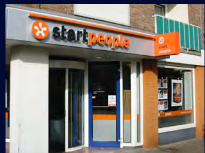
USG: Europese gevelidentificatie voor Start People, Technicum en Unique