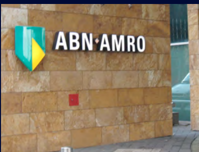
ABN AMRO: product ontwikkeling "Fascia", enorme besparing op de energie en onderhoudskosten.