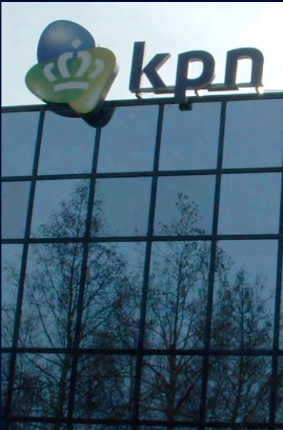
Fabriceren en monteren van doekbakken op 56 gebouwen van KPN